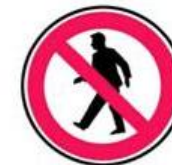
Interzis accesul pietonilor