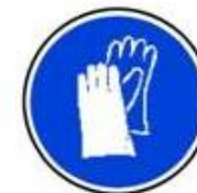
Protecție obligatorie a mâinilor