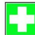
Centru de prim-ajutor