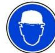
Protecție obligatorie a capului