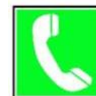
Telefon pentru primul-ajutor sau salvare