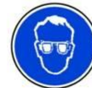
Protecție obligatorie a ochilor